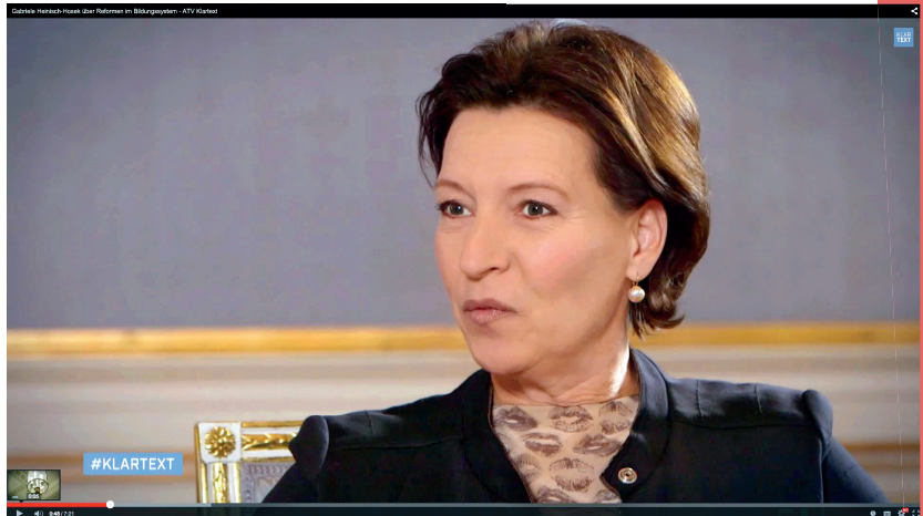
„KLARTEXT“. In der ATV-Sendung spricht Heinisch-Hosek über Bildungsreformen. Zuerst begrüßt sie das Team – laut Expertin, um sich dann auch sicher zu fühlen.

S pannungsfeld Sicherheit – Harmonie: Aus Sicht der „Key to see“-Methode erscheint Gabriele Heinisch-Hosek als eine bedachte Persönlichkeit, die vom Kopf gesteuert wird. Sie selbst würde sich nicht so bezeichnen, da sie sich ihrer stark ausgeprägten Intuition bewusst ist. Jedenfalls handelt sie überlegt und bedacht, Schnellschüsse gibt es keine. Sie entscheidet erst, wenn sie alle Informationen beisammen und alle Konsequenzen, die ihr Handeln haben könnte, durchdacht hat. Allerdings neigt sie auch dazu, die Dinge zu sehr zu „zerdenken“, das nimmt Spontanität, lässt sie zögerlich erscheinen und kann zu Unkonzentriertheit führen. Ebenfalls markant: Menschen wie sie gehen oft vom Schlimmsten aus. Mit ihrer Tendenz zur Schwarzmalerei verbaut sich die Politikerin ihre Spontanität im Alltag und auch das Vertrauen in ihre Mitmenschen. Wenn die Arbeitsstruktur verloren geht, wird ihr unwohl. Dann achtet sie sehr genau darauf, dass niemand von den Kollegen übervorteilt wird, und versucht, mit einer Strategie dem Chaos Herr zu werden. Dabei ist sie es selbst, der sie manchmal nicht vertraut.